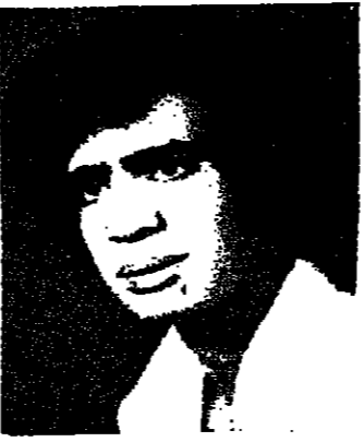
دراسة وتقييم : حسين منصور - رام الله

ما هي الدول البحرية واهميتها الاستراتيجية الدول البحرية هي التي تطل على بحر او بحار مفتوحة للملاحة ولها سواحل طويلة بالنسبة الى مساحتها القارية ،